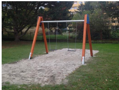
Obrázek 6: Nový herní prvek - zahrada