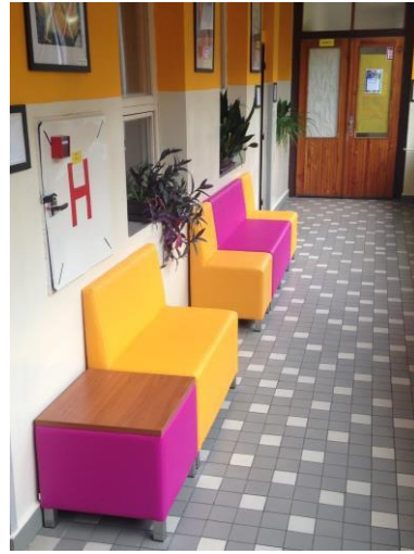
Obrázek 5: Nové interiéry - chodba