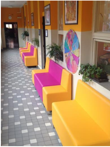
Obrázek 4: Nové interiéry - chodba