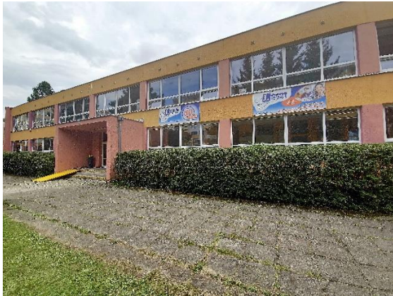
Obrázek 1: budova školy