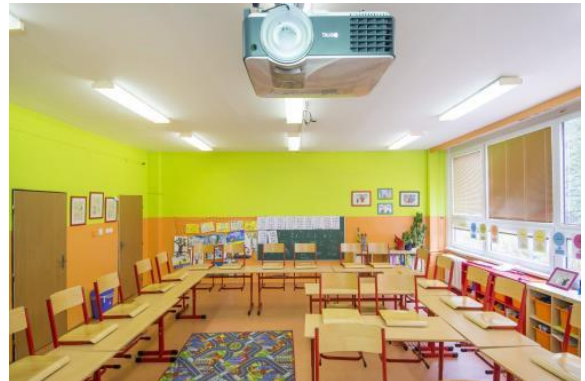
Obrázek 2: interiéry kmenové třídy